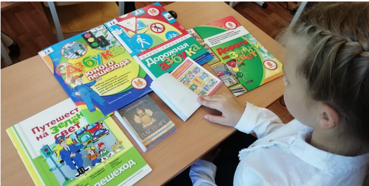
Паспорта безопасности в начальной школе.