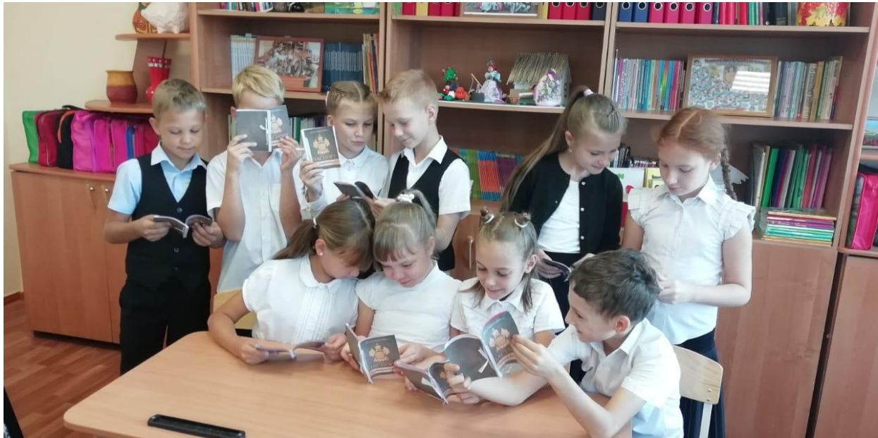
Ура! В За теперь есть паспорта безопасности!