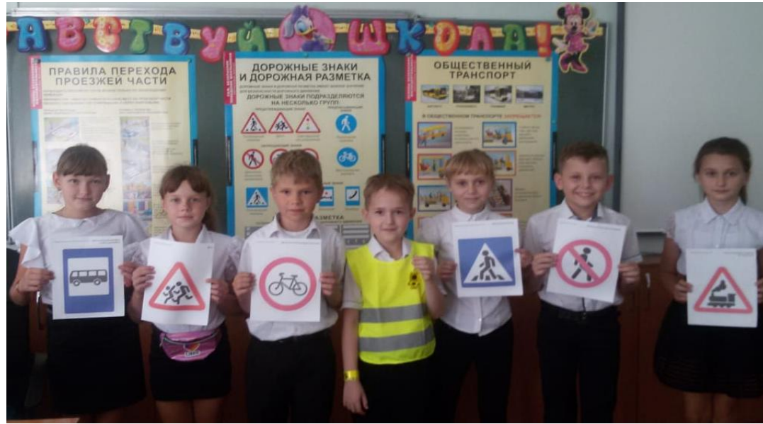
Мероприятия по изучению знаков БДД.