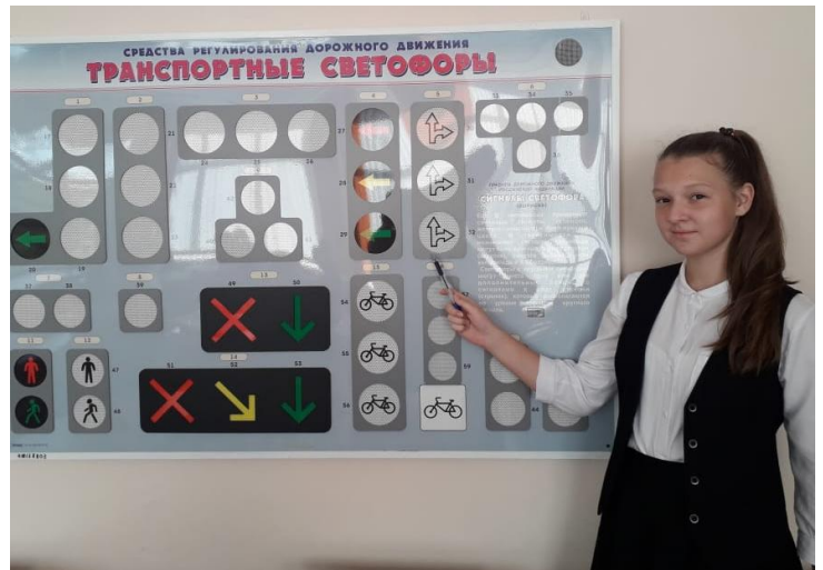
Занятия кружка ЮИД.