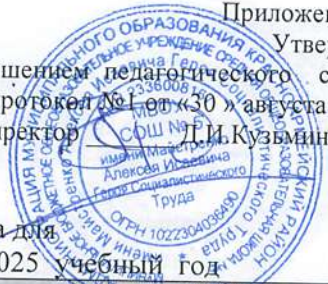
Таблица-сетка часов учебного плана МБОУ СОШ № 5 Красноармейского района для 5 -7 класса, реализующих ФГОС ООО-2021 на 2024 – 2025 учебный год

Приложение №1 Утверждено: решением педагогического совета протокол №1 от «30» августа 2024г. директор Т.И. Кузьмин